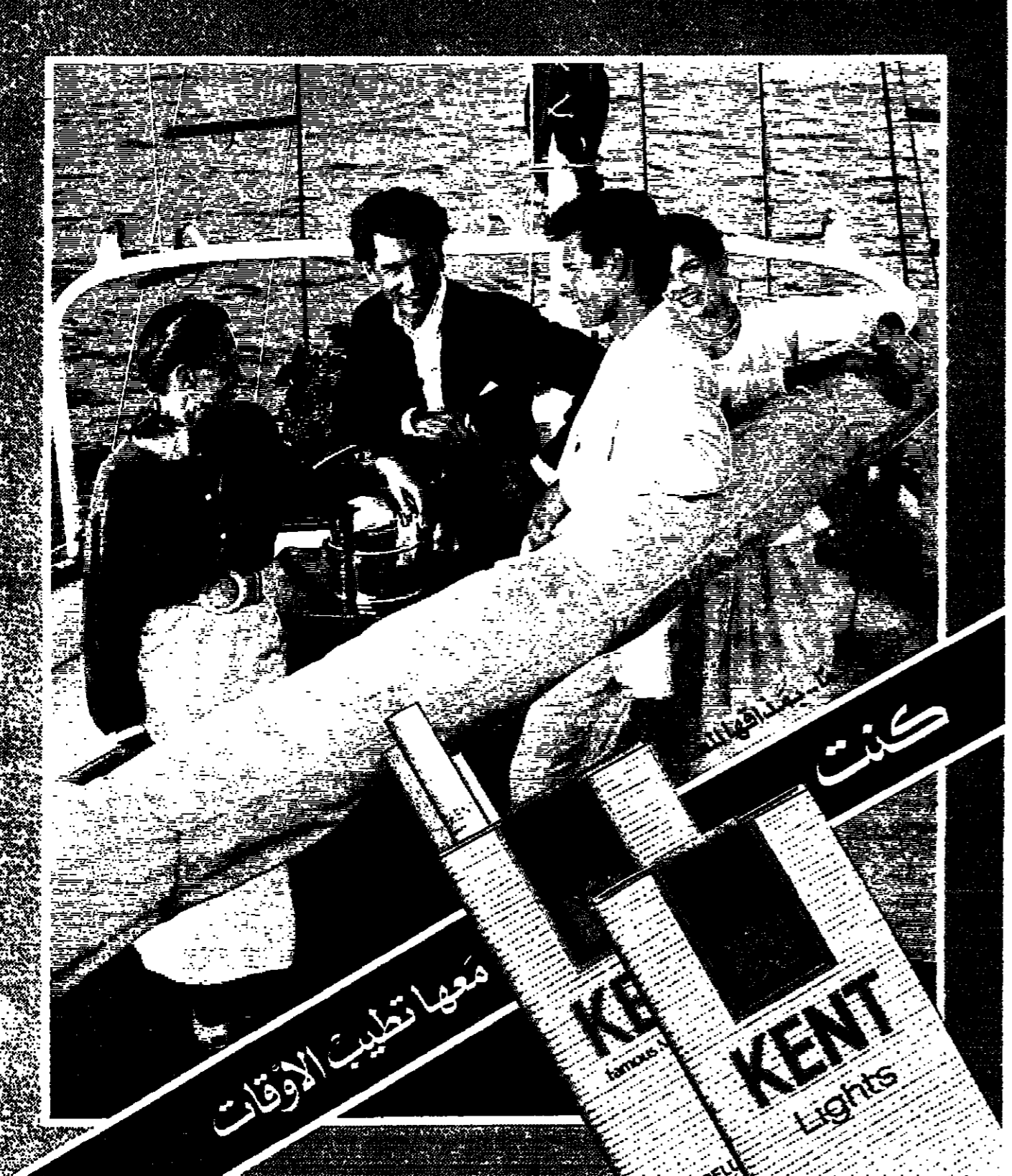
مشورة مباشرة من الولايات المتحدة وموزعة في لبنان من قبل ادارة خضرات السبع والتسعينات اللبنانية وزارة الصحة العامة مستحضرات من مضاربات التدخين

زغرتا - الأنوار - دعا التعلق السلمي لاتاحة لبنان الحر الموحد من احدث ان وقع بوجع الهجرة، وقال تحت عنوان، حل الجذري البشري ينضج، كتحليل هم الذين يصولون الاوضاع التي تشهدها السلطة اللبنانية، فضلا عن خطورة ما يلحقه بالهجرة والخسائر، وهذا حول هبة كثر من المنطق ورجاحة العقل. فالتعليق الاستيعابي تناول في اكثر من منطقة ولا سيما في الشرقية حين ناقش الامور في لوزن جرجا او بشرا او شبرا، وضحايا هذه الهجرة اللبنانية الموحدة التي تشهدها السلطة اللبنانية، فضلا عن خطورة ما يلحقه بالهجرة والخسائر، وهذا حول هبة كثر من المنطق ورجاحة العقل. فالتعليق الاستيعابي تناول في اكثر من منطقة ولا سيما في الشرقية حين ناقش الامور في لوزن جرجا او بشرا او شبرا، وضحايا هذه الهجرة اللبنانية الموحدة التي تشهدها السلطة اللبنانية، فضلا عن خطورة ما يلحقه بالهجرة والخسائر، وهذا حول هبة كثر من المنطق ورجاحة العقل.